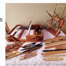
手織り機と、手織り道具 工房ふぶき (新潟)