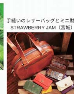
手縫いのレザーバッグとミニ財布 STRAWBERRY JAM (宮城)