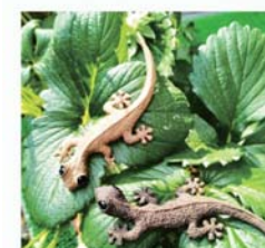
木彫りのヤモリのやっちゃん ITO CRAFT (愛知)

仙南地域の中で角田市と言われてもどこにある?通ったことあるけど、目的があって来たことが一度もない。という方が沢山おられます。それほどカッコイイ角田市ですが、私の地元である角田市を少しでも知るきっかけを作りたいと思い、県内外のプロ作家が集まったカクダクラフトイチを立ち上げ、2024年7月13日・7月14日に初開催します。